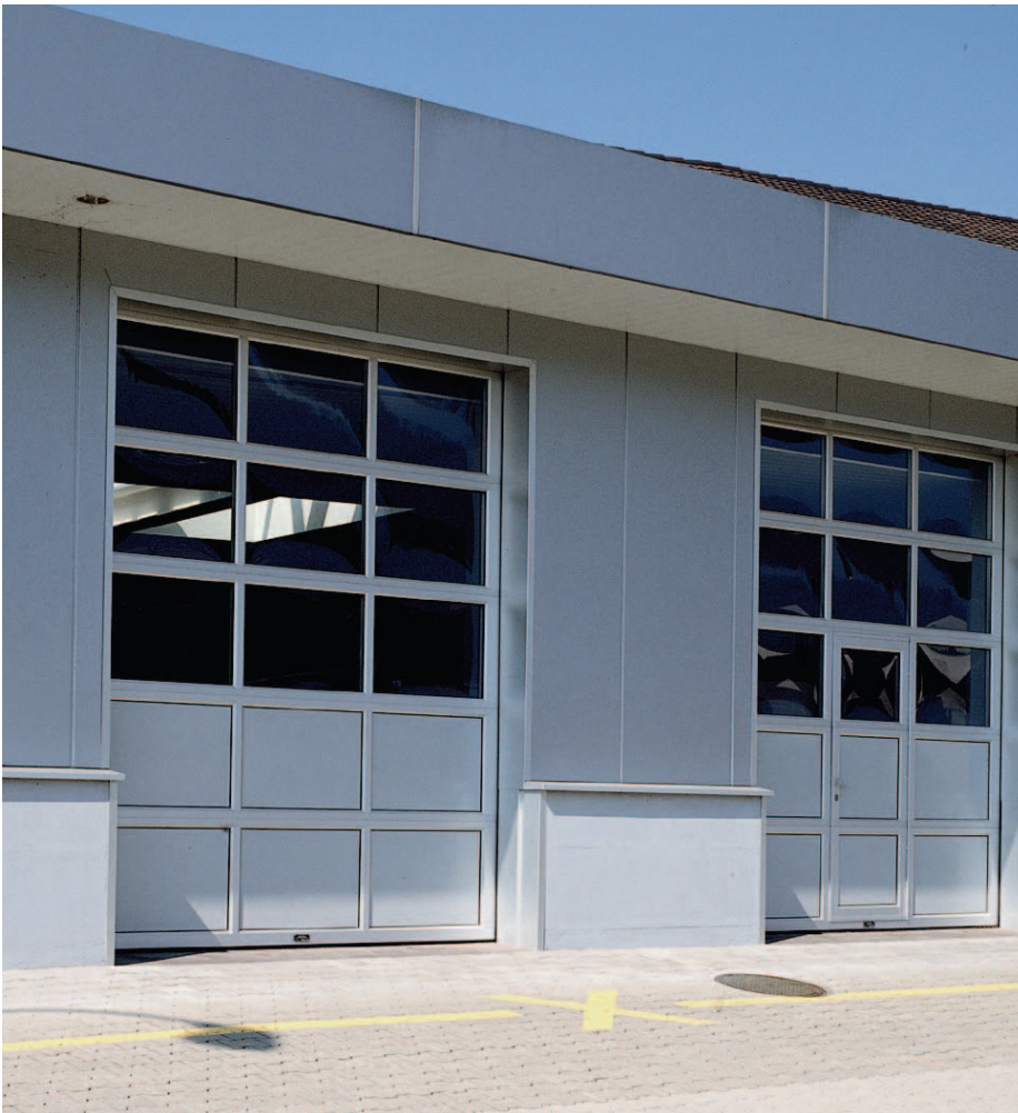
Fassadenansicht mit Sektionaltore